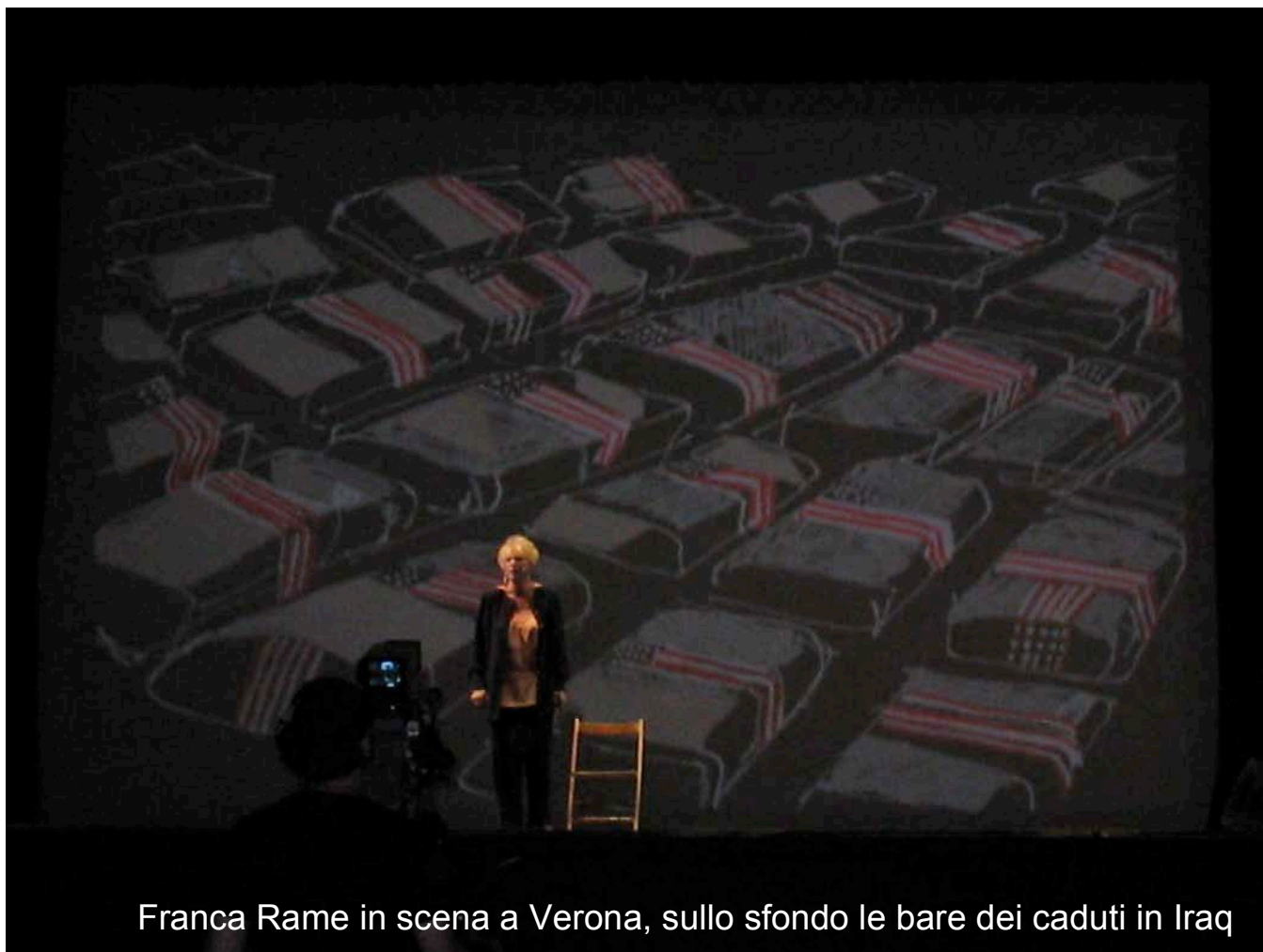
Franca Rame in scena a Verona, sullo sfondo le bare dei caduti in Iraq