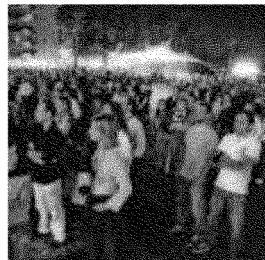
La piazza colma di gente

naia le persone, infatti, che attratte dall'inusuale apertura ne hanno approfittato per visitare le collezioni e i reperti unici al mondo contenuti nelle sue sale. ♦